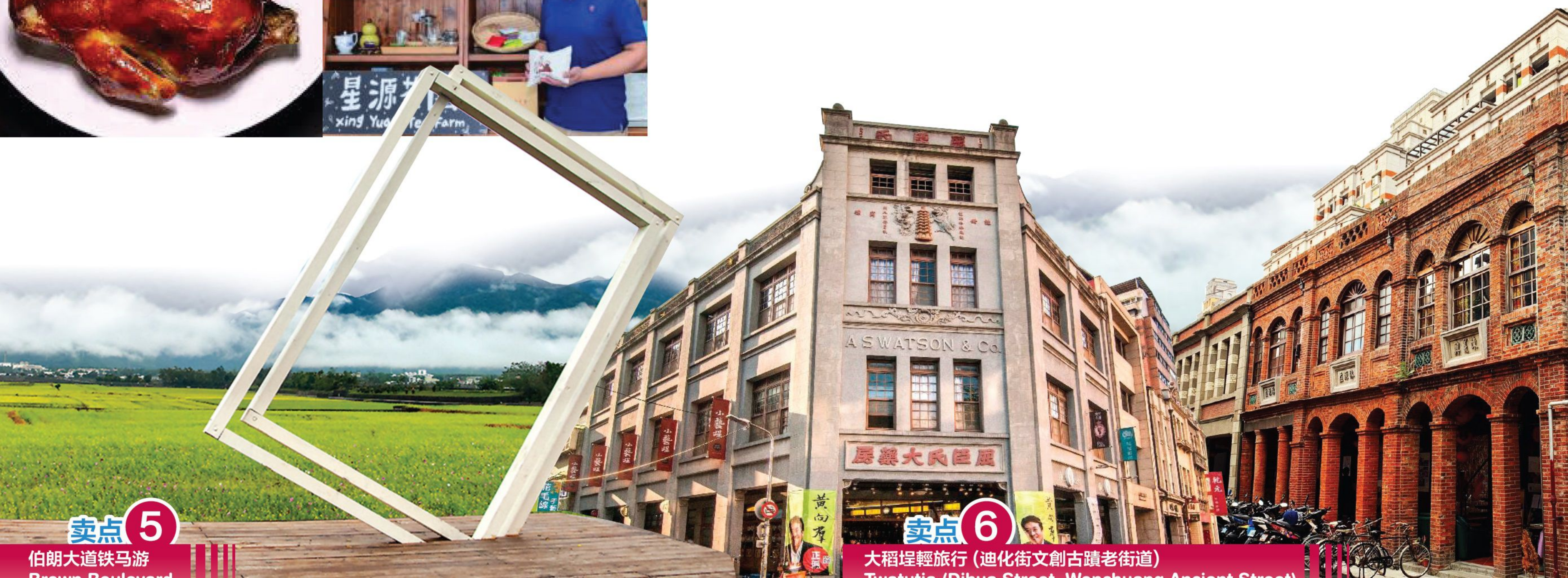
卖点 5 伯朗大道铁马游 Brown Boulevard