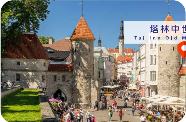
塔林中世纪古镇 Tallinn Old Medieval Town