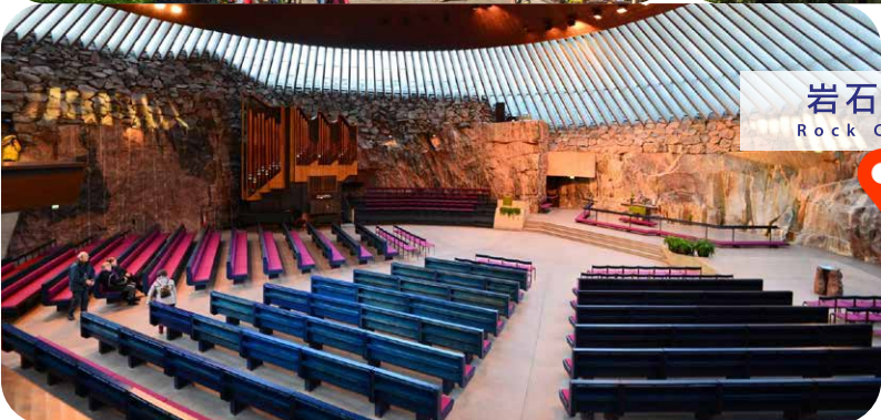
岩石教堂 Rock Church