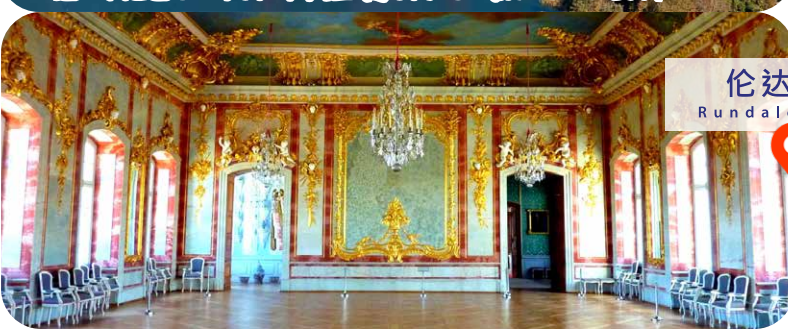
伦达尔宫 Rundale Palace

在一座小山顶上有一个奇怪而鼓舞人心的景象, 这里有无数朝圣者种下的成千上万十字架 Atop a small hill is a strange and inspiring sight, here stand thousands upon thousands of crosses planted by countless pilgrims