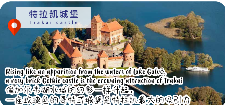
特拉凯城堡 Trakai castle

Rising like an apparition from the waters of Lake Galvė, a rosy brick Gothic castle is the crowning attraction of Trakai 像加尔韦湖水域的幻影一样升起, 一座玫瑰色的哥特式城堡是特拉凯最大的吸引力