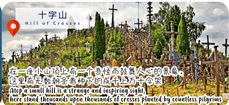
十字山 Hill of Crosses

在一座小山顶上有一个奇怪而鼓舞人心的景象, 这里有无数朝圣者种下的成千上万十字架 Atop a small hill is a strange and inspiring sight, here stand thousands upon thousands of crosses planted by countless pilgrims