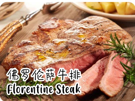
佛罗伦萨牛排 Florentine Steak