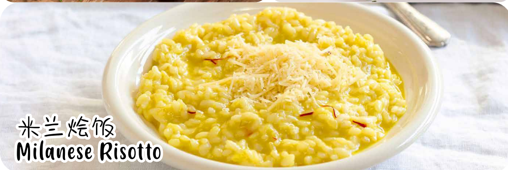
米兰烩饭 Milanese Risotto