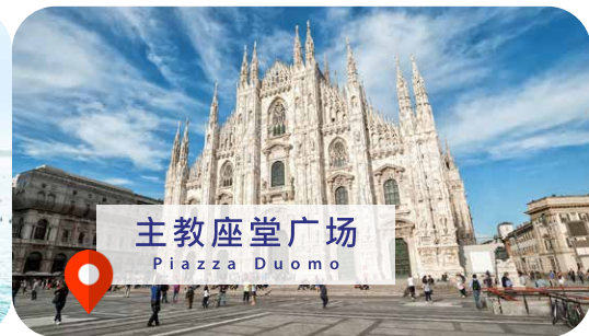
主教座堂广场 Piazza Duomo