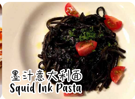
墨汁意大利面 Squid Ink Pasta