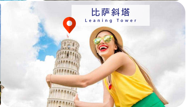
比萨斜塔 Leaning Tower