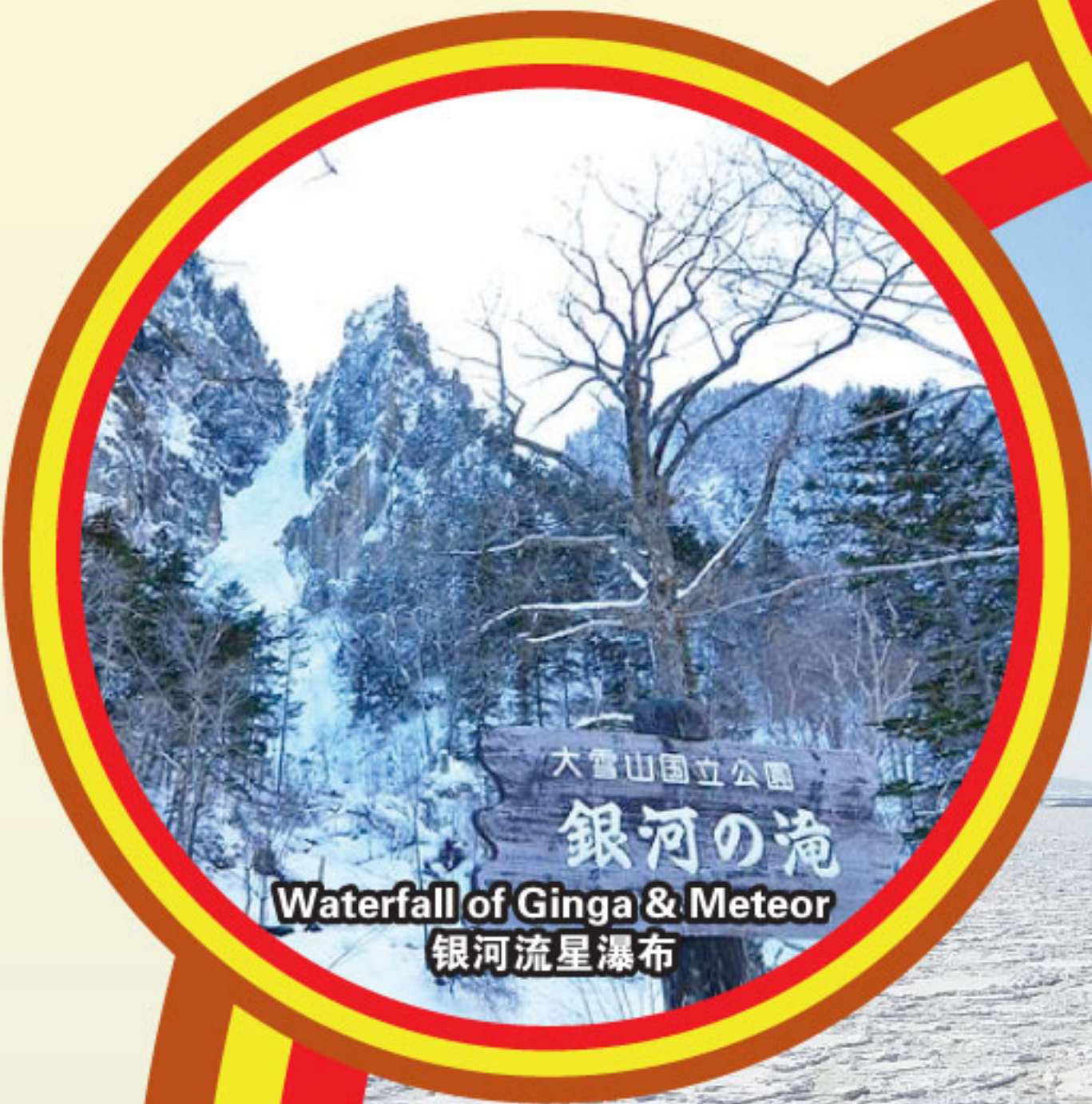
大雪山国立公園 銀河の滝 Waterfall of Ginga & Meteor 银河流星瀑布