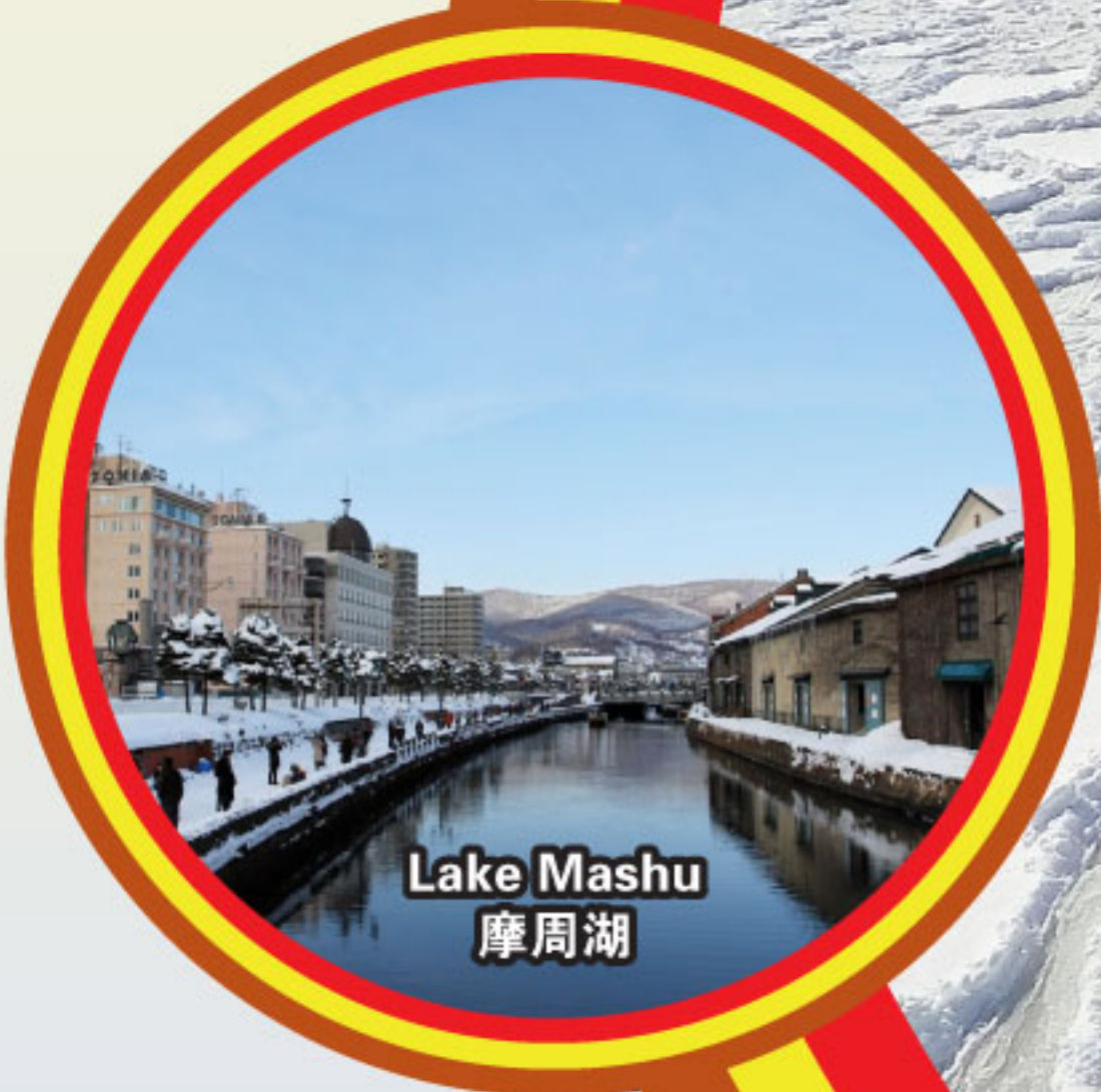
Lake Mashu 摩周湖