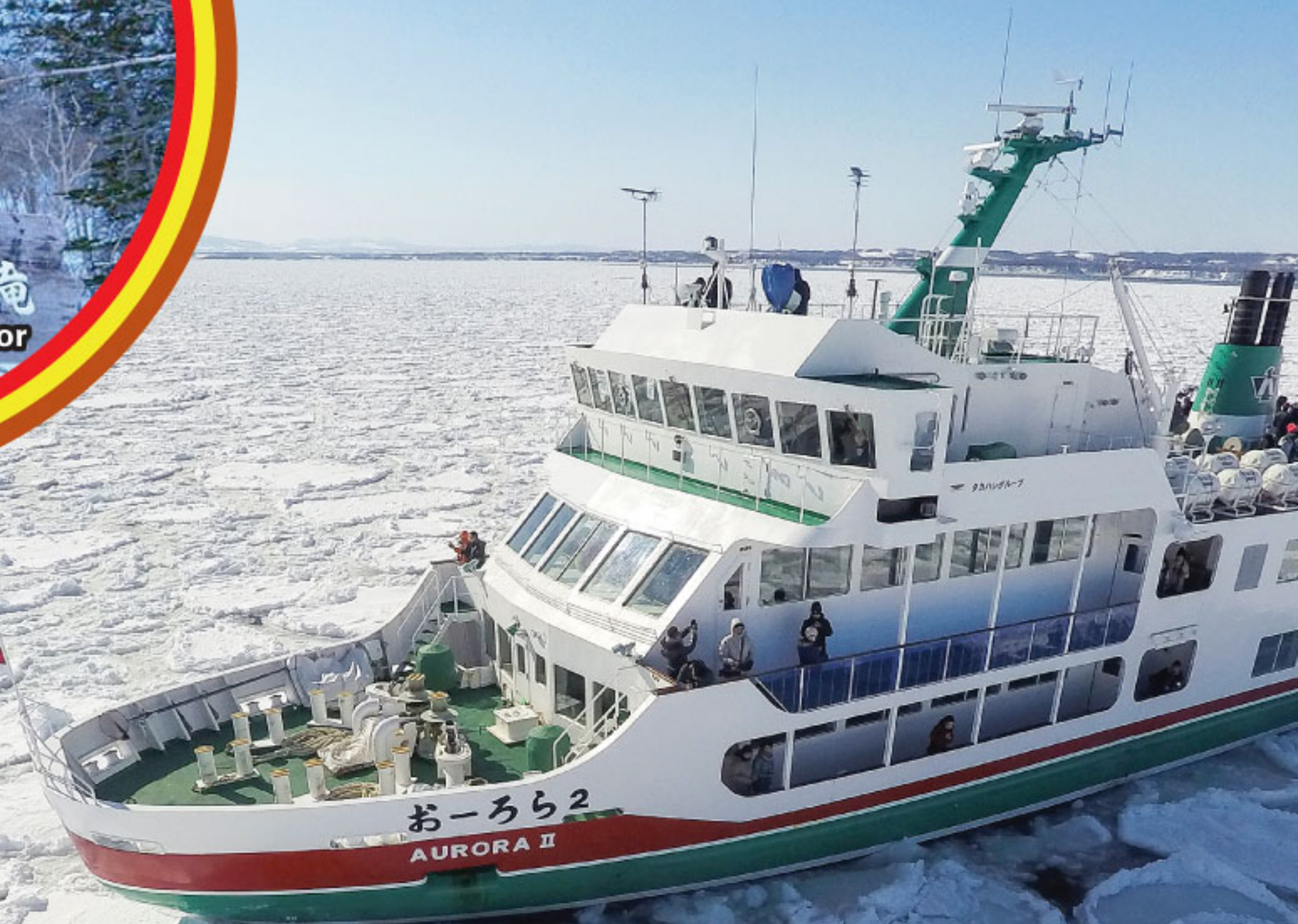
Abashiri Ice Breaker Cruise 网走破冰船