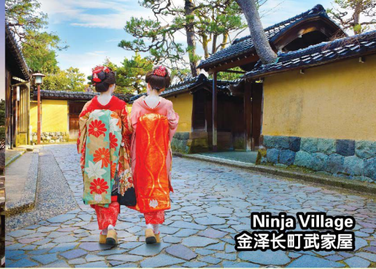
Ninja Village 金泽长町武家屋