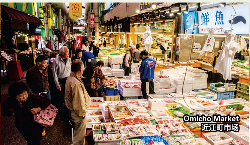
Omicho Market 近江町市場