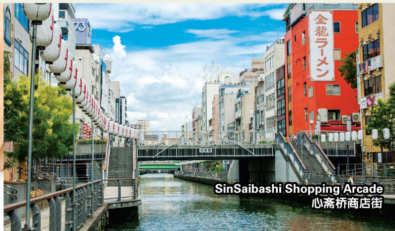
SinSaibashi Shopping Arcade 心斋桥商店街