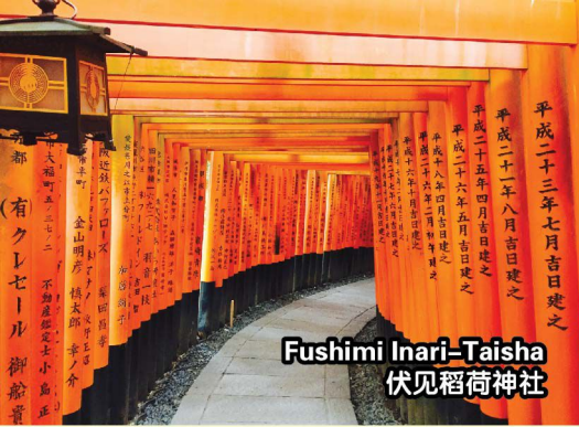
Fushimi Inari-Taisha 伏见稻荷神社