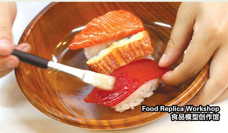
Food Replica Workshop 食品模型创作馆