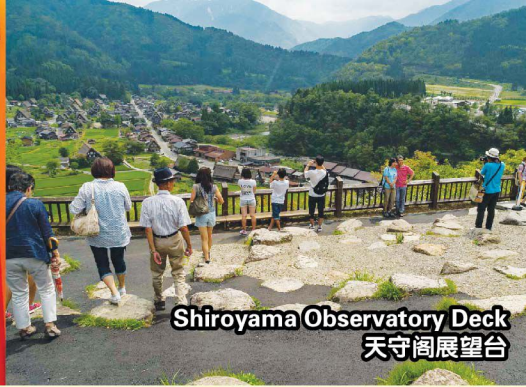
Shiroyama Observatory Deck 天守阁展望台