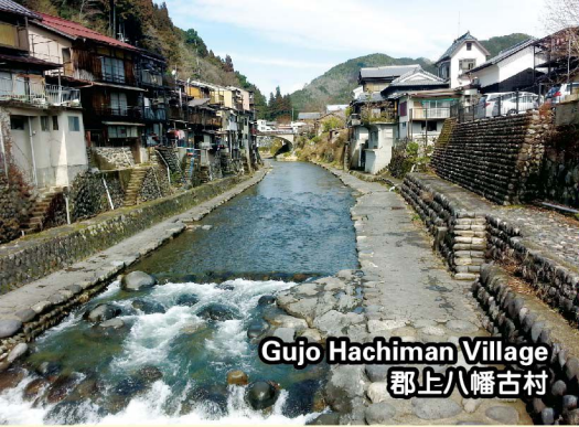
Gujo Hachiman Village 郡上八幡古村