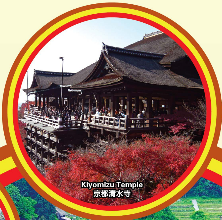
Kiyomizu Temple 京都清水寺