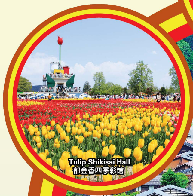
Tulip Shikisai Hall 郁金香四季彩馆