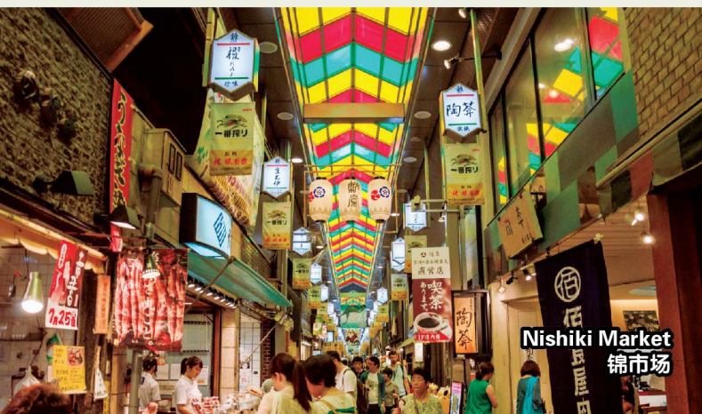
Nishiki Market 錦市場