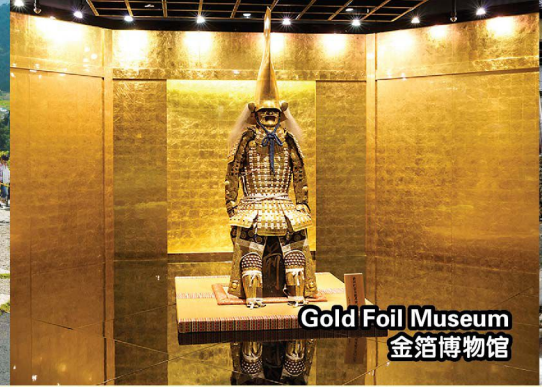
Gold Foil Museum 金箔博物館