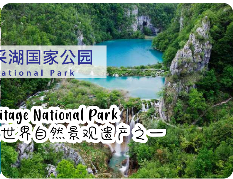
普利特维采湖国家公园 Plitvice National Park

UNESCO World Heritage National Park 列为联合国教科文组织世界自然景观遗产之一