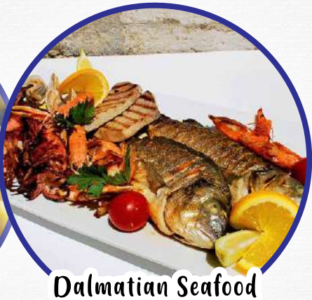
Dalmatian Seafood 达尔马提亚海鲜