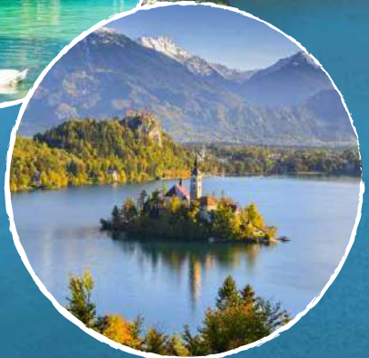
布莱德湖 Lake Bled