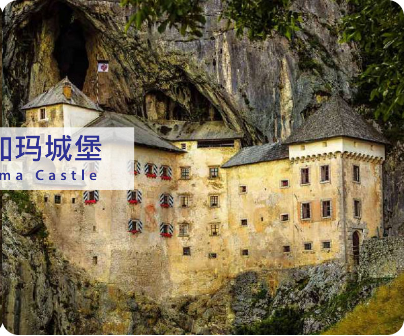
布列加玛城堡 Predjama Castle